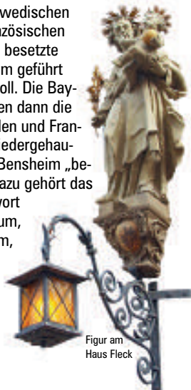
Figur am Haus Fleck

rische Soldaten in das von schwedischen und französischen Truppen besetzte Bensheim geführt haben soll. Die Bayern haben dann die Schweden und Franzosen niedergehauten und Bensheim „befreit“. Dazu gehört das Sprichwort „Hinnerum, hinnerum, wie die Fraa von Bensem.“