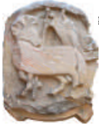
Spolie an der Fassade

Ältester Teil des Dalberger Hofes dürfte der 1587 erbaute Turm mit einer geschweiften Haube aus