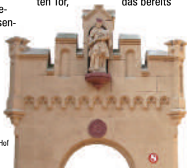
Portal am Hohenecker Hof

Der wohl Anfang des 14. Jahrhunderts errichtete Rinnentorturm bildet den Rest einer größeren Wehranlage mit einem nach Süden über die Straße gespannten Tor, das bereits