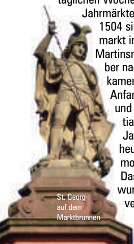
St. Georg auf dem Marktbrunnen