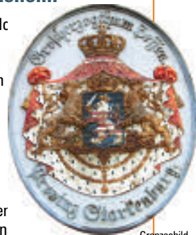
Grenzschild am Museum

Das nach Norden eingeschossige, nach Süden zweigeschossige traufständige Museumsgebäude geht wohl auf der Rest des ehemaligen Lorsch Klosters zurück. Die südliche Fachwerkwand über dem wahrscheinlich älteren, massiven