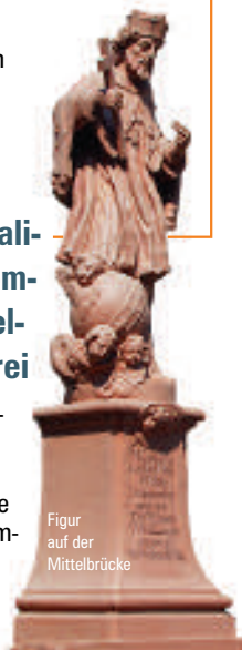
Figur auf der Mittelbrücke

Überaus repräsentativ beherrscht die 1732 errichtete ehemalige Domkapitelfaktorei